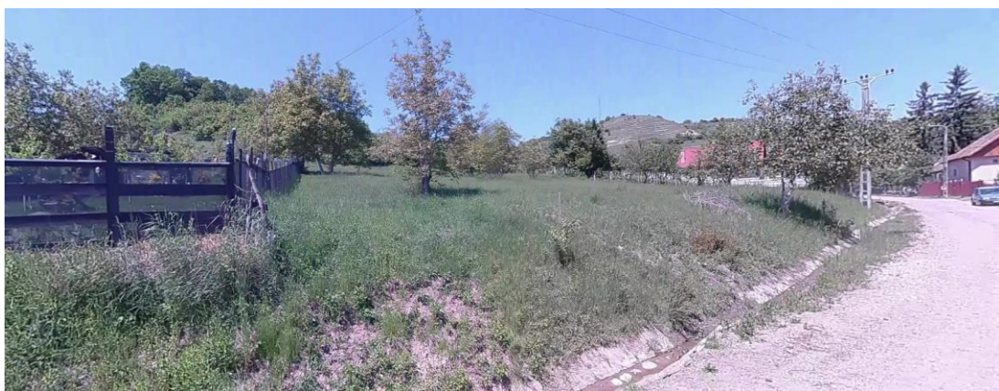
Teren nr. Cadastral 55939, vedere din strada Lebedei colțul sudic-estic

Documentație fotografică situația existentă: