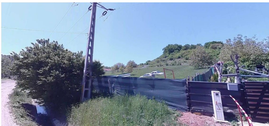
Teren nr. Cadastral 53643, vedere din strada Lebedei colțul nord-estic