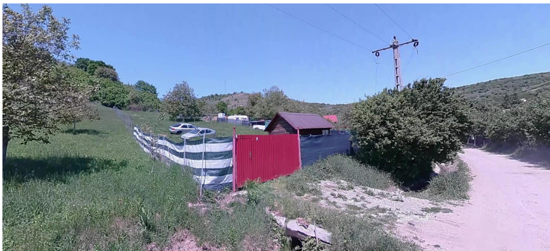
Teren nr. Cadastral 53643, vedere din strada Lebedei colțul sudic-estic