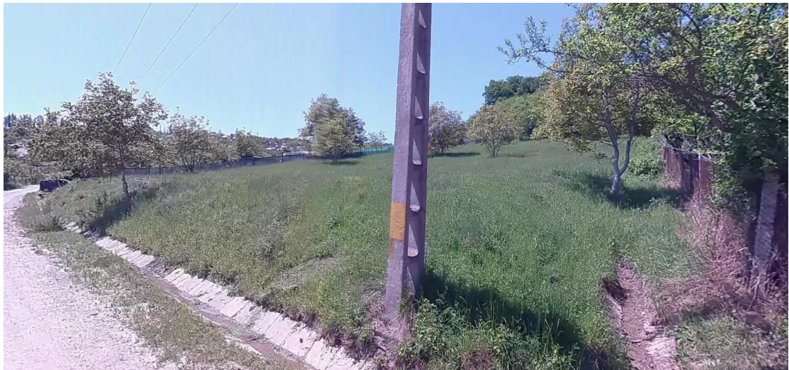
Teren nr. Cadastral 55939, vedere din strada Lebedei colțul nord-estic